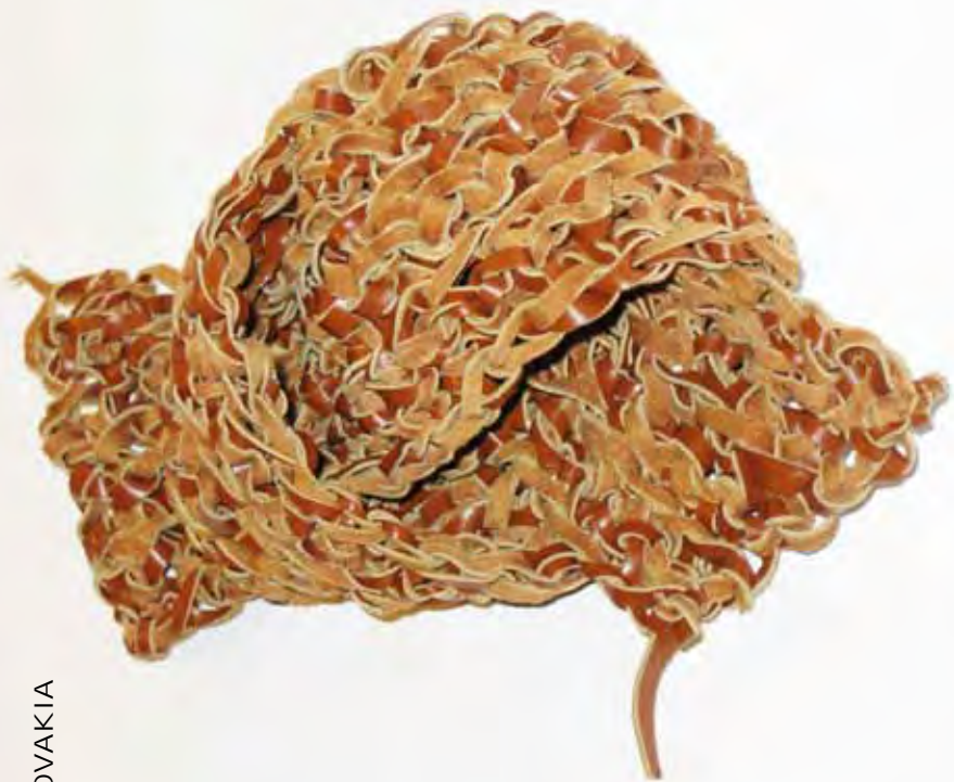
Sujanová Zuzana, Uzlik št'astia