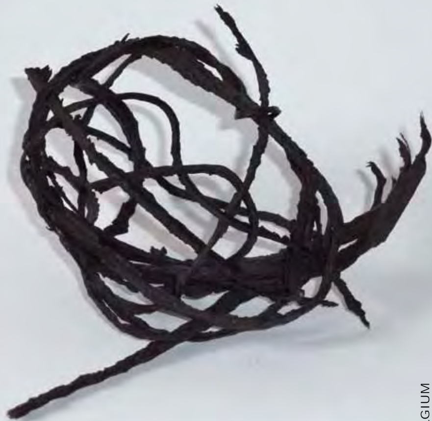
Cvetkovic Zlatko, Push the button