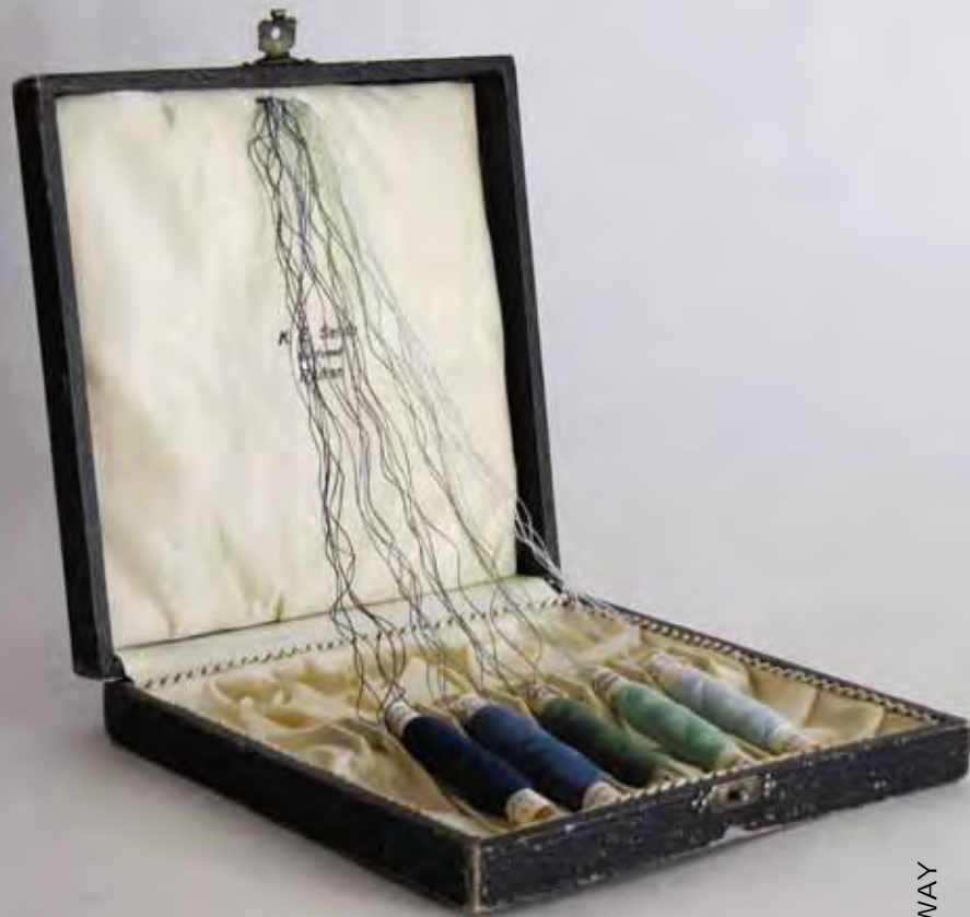
Arppe Nadja, In the Morning