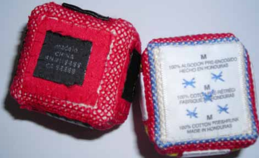
Hromadová Zuzana, €-balíček